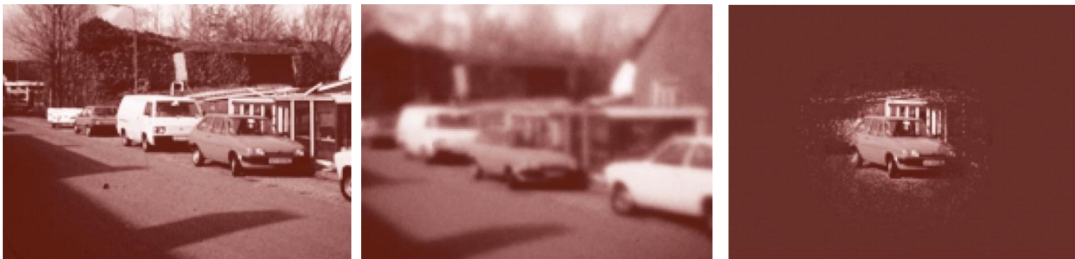
Afbeelding 1. Van links naar rechts: normaal gezichtsvermogen; sterk verminderde gezichtsscherpte van 10 graden; kokervisie (Hofman et al., 2007, p.26)

Iemand die slechtziend is en een visus heeft die kleiner is dan 0,3 of een gezichtsveld van minder dan 30 graden, heeft in Nederland al te maken met veel beperkingen. Autorijden is verboden, en zonder speciale aanpassingen zijn lezen en werken op een computer erg moeilijk. Afbeelding 1 geeft een indicatie van wat een slechtziende en blinde (niet) zien.