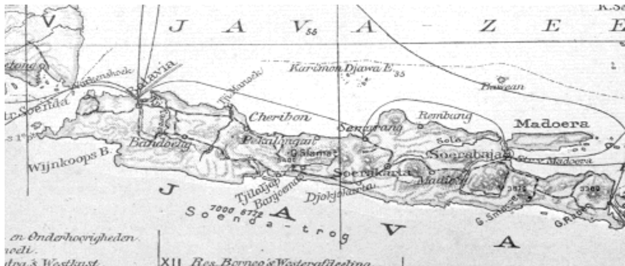
Afbeelding 2.

De belangrijkste stad op het eiland was de hoofdstad Batavia, het huidige Jakarta. Het gebied waar de huidige stad zich bevindt, werd al ruim voor de komst van de Nederlanders bewoond. Vanaf 1619 ontwikkelde Batavia zich tot het hoofdkwartier van de VOC. In de loop van de zeventiende eeuw groeide de macht van de VOC en daarmee ook het gebied dat onder de heerschappij van de Compagnie stond. Batavia werd het belangrijkste handelsknooppunt in de Indische Archipel. 86 De stad ligt op de westkant van het eiland aan een goed beschutte baai, in een vlakke maar op sommige plekken moerassige omgeving. De stad beschikte over een grote haven, Tandjong-Priok waar gedurende de dekolonisatieperiode de schepen met Nederlandse militairen aankwamen. In 1942 viel Batavia in Japanse handen en werd de naam veranderd in Djakarta. Tegenwoordig wordt het voormalige Batavia aangeduid als Jakarta en is het de hoofdstad van het moderne Indonesië. 87