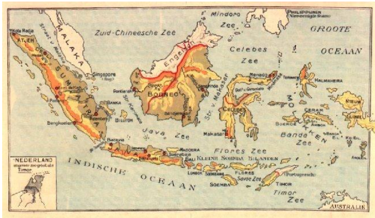
Afbeelding 1.

en Timor de belangrijkste zijn. In totaal besloeg het landoppervlakte van Nederlands-Indië een gebied ter grote van Duitsland, Frankrijk en Engeland tezamen. 83