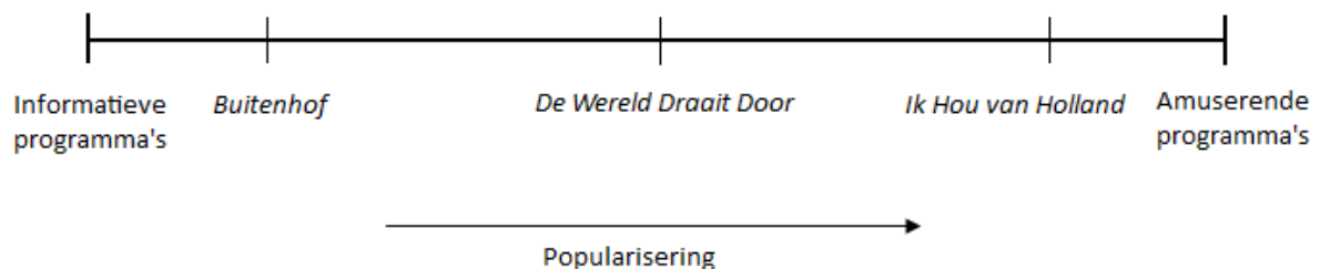
Figuur 2.1: Het continuüm van de gepopulariseerde politiek.

Bij het analyseren van de politieke communicatie kan popularisering van politiek gezien worden als een continuüm, een schaal met twee polen. Aan één kant bevindt zich het domein van programma's met hard en serieus nieuws waarbij politieke ontwikkelingen een essentiële rol spelen. Aan de andere kant bevindt zich een domein van programma's waar de nadruk ligt op zacht nieuws met amusementswaarde, waarbij onderwerpen zoals lifestyle, gossip en schandalen centraal staan (Van Praag & Brants, 1995). Waar de politiek zich voorheen voornamelijk aan de kant van het harde en serieuze nieuws bevond, maakt deze tegenwoordig een verschuiving naar de kant van het amusement. Een schematische weergave van dit continuüm is weergegeven in figuur 2.1.