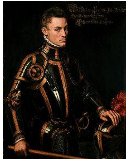
Afbeelding 3: Willem van Oranje afgebeeld in de katholieke geschiedenismethode uit 1964. 132

Willem van Oranje wordt hier ook gepresenteerd als de 'Vader des Vaderlands' en als de 'beste' leider van het verzet tegen de Spanjaarden. 131 Kortom, hij is volgens deze geschiedenismethode onbetwist de nationale held van de Opstand. Zoals hierboven al is vermeld wordt aan Willem van Oranje veel aandacht besteed in deze geschiedenismethode. Uit de kwalitatieve analyse blijkt dat hij de rol krijgt toegewezen van een nationale held die de eenheid binnen Nederland zou vertegenwoordigen. Hij fungeert daarbij als de verpersoonlijking van verdraagzaamheid en tolerantie. Daarom is het niet vreemd dat hij zo vaak wordt genoemd. Hij vertegenwoordigt immers de eenheid van alle Nederlanders en geldt als held van iedereen.