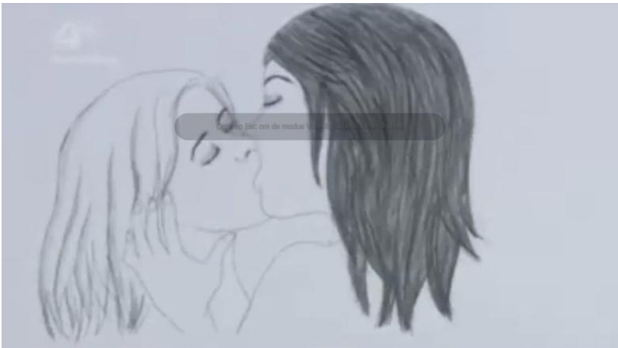
Afbeelding 24 . Naomi kust Sophia.