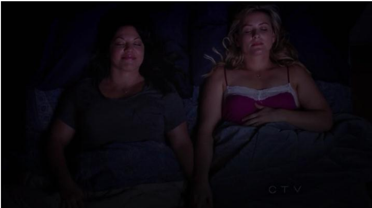
Afbeelding 6. Callie & Arizona in bed.