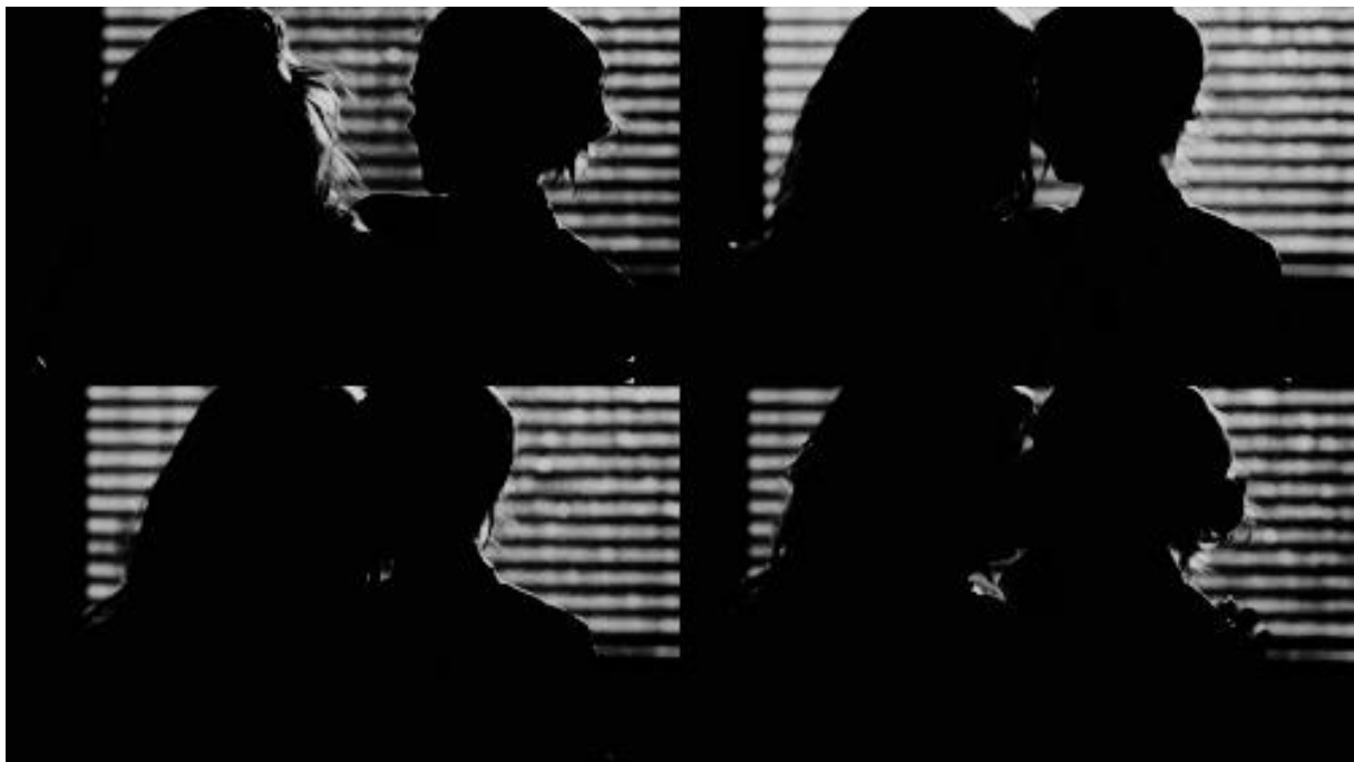
Afbeelding 20. Arizona & Lauren (1)