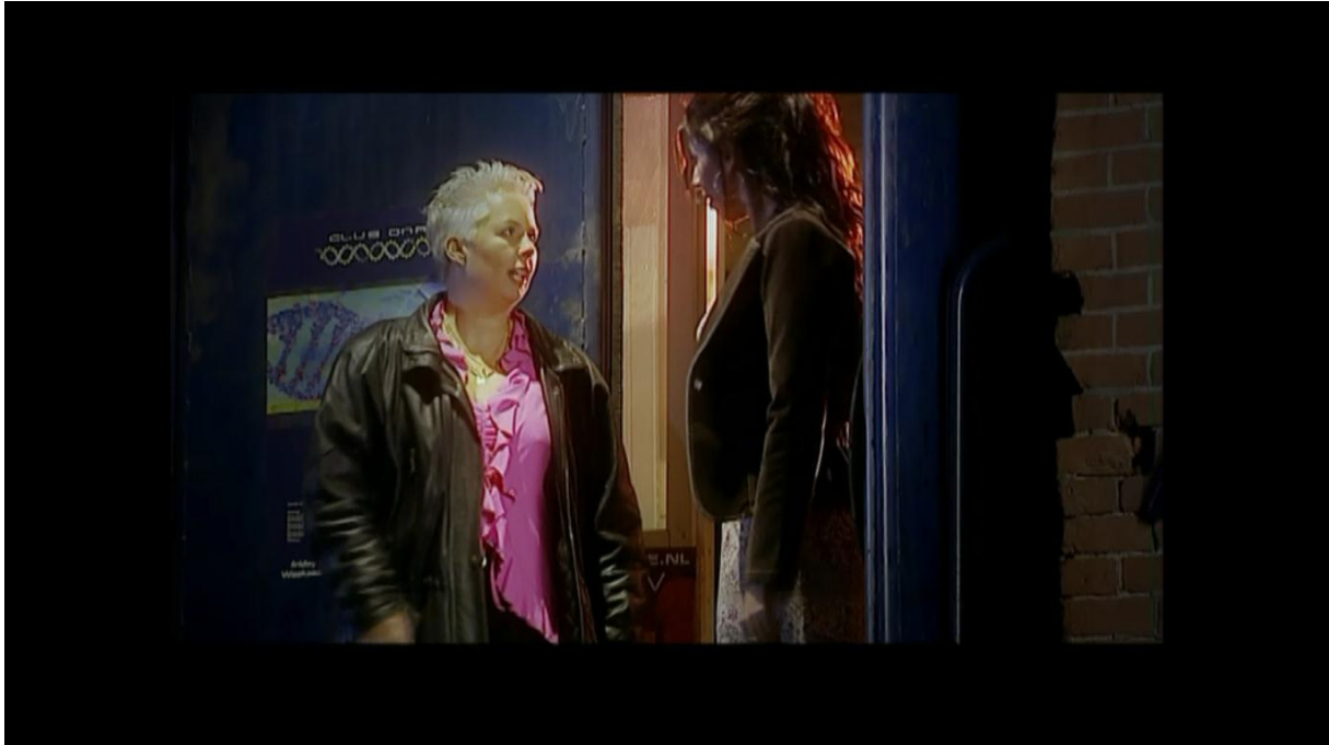
Afbeelding 13. Uitsmijter van de lesbische club.