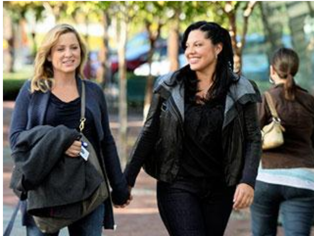
Arizona en Callie