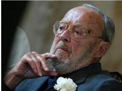
Afbeelding I: Bernhard van Lippe-Biesterfeld

Om een brug te slaan naar de realiteit komen kenmerken van de echte personen terug in de karakters. Zo heeft Beatrix het wel bekende haar. Hoe ouder Beatrix in de serie wordt, hoe herkenbaarder het kapsel wordt. Ook Máxima heeft een herkenbare haardracht, zij draagt in de afleveringen haar haar in een laag zittende knot. De grootste overeenkomst kan echter gevonden worden in het personage van Bernhard.