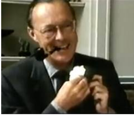
Afbeelding III: Bernhard van Lippe-Biesterfeld