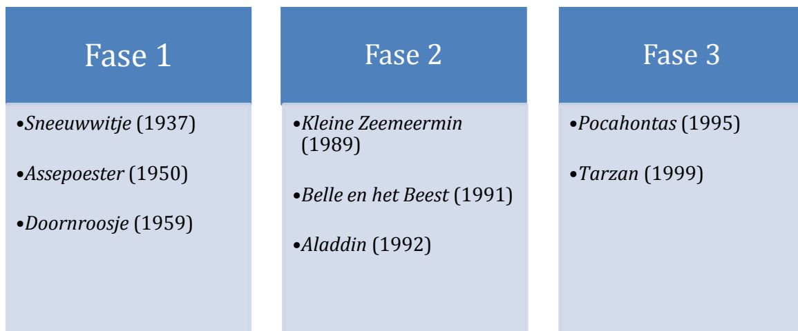
Figuur 1. Tijdslijn met jaren van release.

Ten tweede verandert de manier waarop liefde geuit wordt, waarbij het huwelijk een steeds minder prominente rol gaat spelen. In de eerste zes film betekent de ultieme uiting van liefde het huwelijk. In de laatste twee films, Pocahontas en Tarzan , komt het huwelijk niet aan de orde en is het belangrijker dat de liefde die in het verhaal centraal staat, geaccepteerd en uitgesproken wordt. Het huwelijk is niet meer de enige manier om liefde te waarborgen en is dus ook niet meer het ultieme doel in het leven van de hoofdpersonen.