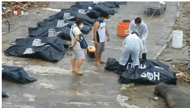
Afbeelding 3: Doden worden geïdentificeerd in het NOS Journaal

Ook binnen de items van het NOS Journaal is sprake van coherentie tussen tekst en beeld. Dit komt bijvoorbeeld naar voren als het gaat over het moeizame verloop van de identificatie van lijken door het grote aantal. De bijbehorende beelden tonen een grote hoeveelheid lijkzakken die naast elkaar in rijen liggen en mensen in witte pakken die er een openen zodat nog levende slachtoffers kunnen kijken of zij de dode persoon kunnen identificeren (afbeelding 3).