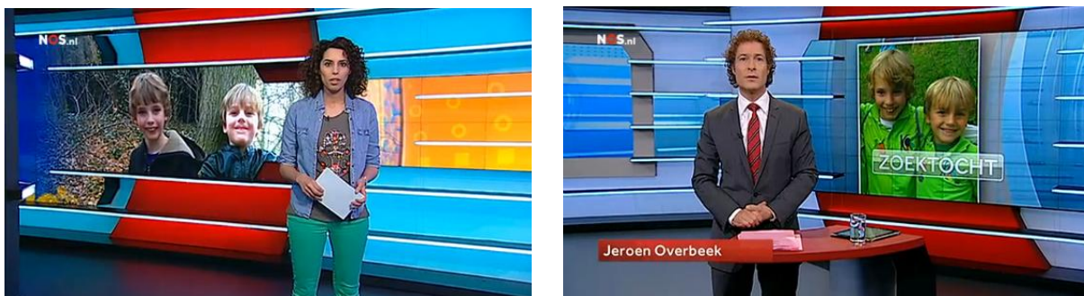
Afbeelding 5: Presentatoren Jeugdjournaal en NOS Journaal in de studio

Het Jeugdjournaal betreft tevens de kinderen bij het nieuws door de kinderen persoonlijk aan te spreken. De presentator, maar ook de verslaggever op locatie, praat direct naar het publiek toe met woorden als 'je', 'jij' en 'jullie'. Dit gebeurt onder andere bij de afsluiting, zoals hierboven is besproken, waarin de kinderen worden oproepen hun reactie te geven of meer informatie op de site kunnen op te zoeken. Ook spreekt de nieuwslezer van het Jeugdjournaal regelmatig over 'wij' of 'we', bijvoorbeeld: "Op onze website krijgen we van jullie veel reacties over dit nieuws" en "Wij gingen langs op basisschool Het Mozaïek in Veenendaal." Door het gebruik van woorden als 'jij' en 'wij' wordt het gevoel van betrokkenheid van de kinderen vergroot.