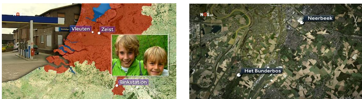
Afbeelding 2: Kaartaanduiding Jeugdjournaal en NOS Journaal

Hoewel uit de kwantitatieve analyse is gebleken dat voornamelijk het Jeugdjournaal gebruik maakt van animaties, komen deze in beide journaals voor in zowel de berichtgeving over de Filipijnen als over Ruben en Julian. De items tonen animaties die de plaats van de nieuwsgebeurtenissen aanduiden. In het geval van de orkaan laat een wereldbol zien waar de Filipijnen liggen. Het NOS Journaal duidt op deze kaart echter ook steden aan (Tacloban, Manilla, Ormoc), wat bij het Jeugdjournaal niet gebeurt. Hier wordt de route die de orkaan heeft gevolgd weergegeven door middel van een stippelijntje om aan te geven welke gebieden het zwaarst zijn getroffen. Deze animaties zorgen voor de visualisatie van de manier waarop de orkaan zich heeft verplaatst zodat kinderen zich hier een betere voorstelling van kunnen maken. Bij de items over de vermissing van de broertjes gebruikt het NOS Journaal meerdere malen een satellietkaart van Google Earth die inzoomt op verschillende plaatsen, zoals het tankstation waar de vader is gezien en het bos waar hij later dood is aangetroffen (zie afbeelding 2).