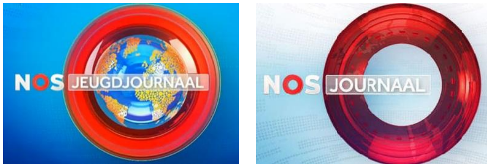
Afbeelding 6: Logo Jeugdjournaal en NOS Journaal

en ook de muziektune tijdens de leader is net iets anders; bij het Jeugdjournaal klinkt deze vrolijker dan bij het NOS Journaal . Het speelsere karakter van het Jeugdjournaal komt ook tot uiting in de kleding van de presentatoren. Deze is altijd casual en meestal kleurrijk, terwijl de nieuwslezers van het NOS Journaal veel netter en ingetogener gekleed zijn. De mannen dragen altijd een pak met stropdas, de vrouwen bijvoorbeeld een colbertje. Dit wekt de indruk van zakelijkheid, seriositeit en autoriteit.