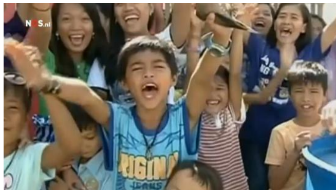
Afbeelding 1: Blije kinderen in het Jeugdjournaal

Een ander opvallend element in de items van het Jeugdjournaal is het kort noemen van iets positiefs aan eind van het negatieve nieuwsbericht. Dit komt naar voren in de items over de Filipijnen. Zo wordt genoemd dat er een baby is geboren tussen al het puin: “Vanuit de puinhopen komt ook goed nieuws. In een vertrekhal van een ingestort vliegveld is een baby geboren. Het is een meisje.” Een ander item sluit af met: “Soms komt er ook goed nieuws. Bij dit weeshuis heeft iedereen de orkaan overleefd.” Hierbij worden beelden van blije kinderen getoond (afbeelding 1), een contrast met de bedroevende emoties in de rest van het item. Het afsluiten van het item met een positief bericht draagt bij aan het verzachten van het heftige nieuws wat de kinderen vlak daarvoor gezien hebben.