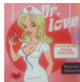
Hitkrant 31, 2005

methodehoofdstuk gegeven definitie van 'seksualiteit' echt als seksueel beschouwd kunnen worden, zijn de door lezers ingezonden zoenfoto's en de tekeningen van een penis en een in een uitdagend zusterpakje geklede dokter, die in de jaren 2004 en 2005 te zien waren in de rubriek 'Hitsig' van de Hitkrant . In 2006 is deze seksrubriek echter uit de Hitkrant verdwenen. Hiermee verdwenen ook de in tienertijdschriften expliciet seksueel getinte afbeeldingen. Vanaf het jaar 2006 bevat de Hitkrant , net zoals de CosmoGIRL! al sinds 2004, vooral afbeeldingen waarop verliefdheid, liefde en relaties te zien zijn en geen expliciete verwijzingen naar seks. Hierdoor bevatten de bladen in de periode 2004-2013 hoofdzakelijk afbeeldingen die wijzen op de samenhang tussen seks en liefde.