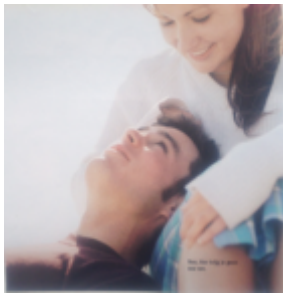
CosmoGIRL! 12, 2004