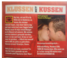
Hitkrant 26, 2004

Het vertoog dat seks samenhangt met liefde komt gedurende de hele onderzochte periode duidelijk in de bladen naar voren en is in de tekst steeds op dezelfde, de hierboven beschreven manier geconstrueerd. Echter, de samenhang tussen seks en liefde komt ook naar voren in de afbeeldingen die in de tienertijdschriften gebruikt zijn. De bladen bevatten in de afgelopen tien jaar bijna geen seksuele afbeeldingen (de Girlz! -rubrieken bevatten helemaal geen afbeeldingen). De enige afbeeldingen die naar aanleiding van de in het