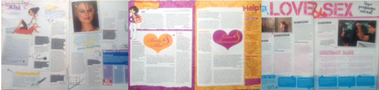
Hitkrant 34, 2006

seksualiteit onderdeel uitmaakt van hun leven. De tienerbladen zijn hierdoor sinds 2006 niet meer 'algemene kennisverspreiders', maar vooral 'persoonlijke informatieverstrekkers en raadgevers'.