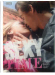
CosmoGIRL! 114, 2013

Dat geen van de onderzochte tienertijdschriften vanaf 2006 seksuele afbeeldingen bevatten, is opvallend wanneer gekeken wordt naar voorgaand onderzoek. De Bruin (1999) constateerde namelijk dat er in de periode 1987-1997 zeer expliciete seksafbeeldingen aanwezig waren in de jongerenbladen, waaronder foto's van modellen die seksstandjes toonden. De vergelijking van dat soort foto's met de zoenfoto's en de tekeningetjes die in 2004 en 2005 in de Hitkrant aanwezig waren, resulteert in de conclusie dat in 2004 al de afname van (expliciet) seksueel getinte afbeeldingen in tienertijdschriften ingezet was.