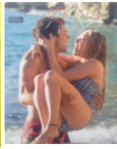
CosmoGIRL! 9, 2008