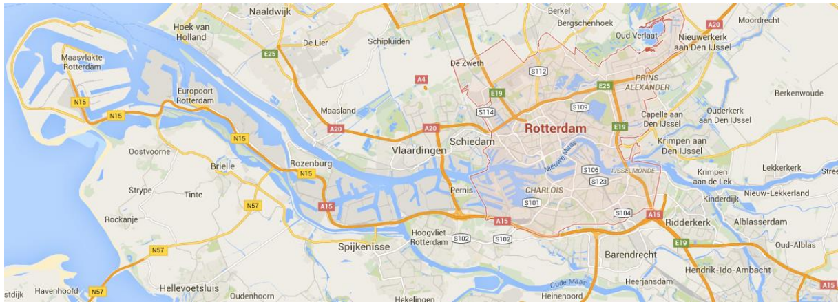
Figuur 5.1 Wegennet Rotterdam – Afbeelding Google Maps