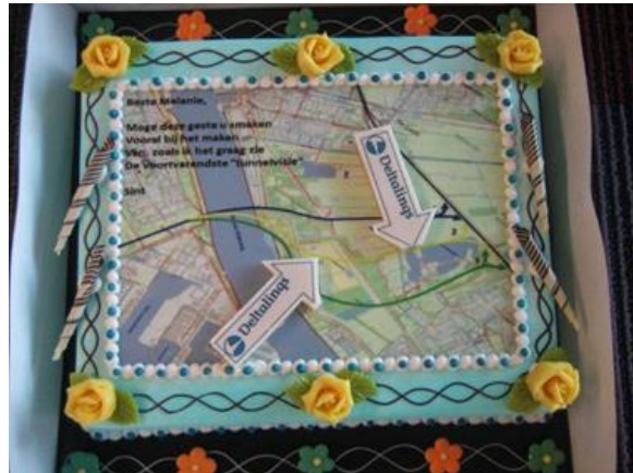
Figuur 5.3 taart voor de minister

De minister maakt op 7 december haar voorkeursbeslissing bekend: Blankenburgtracé, Krabbeplass West.