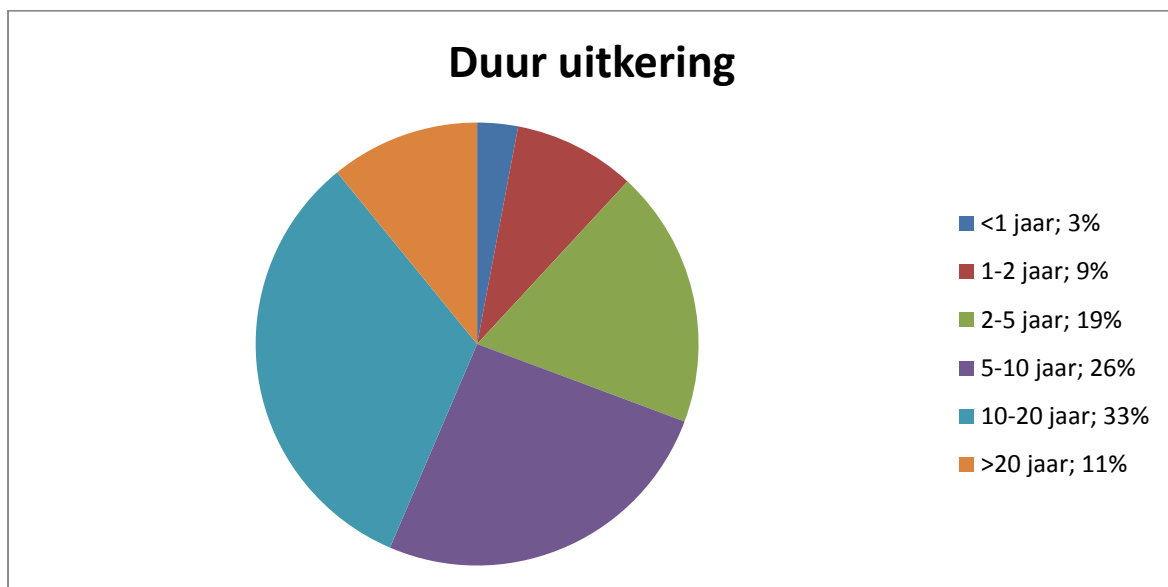
Figuur 2. Doelgroep Maatschappelijke Inspanning in Pendrecht, onderverdeeld naar duur van een WWB uitkering.

(figuur is opgesteld o.b.v. Burger:2013)