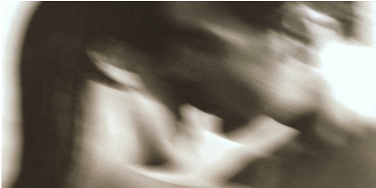
Figuur 4. Schimmen van personen als introductiefoto bij een artikel over seksuele verlangens.

Fragment uit Elle , 2015, Vurige feestdagen.