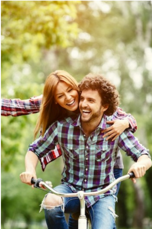
Fragment uit Glamour , 2015, 6 datingregels die je mag breken.

Naast heteroseksualiteit is er binnen de artikelen ook ruimte voor een minder voorkomende seksuele identiteit namelijk homoseksualiteit. Homoseksualiteit houdt in dat de twee personen in de relatie van hetzelfde geslacht zijn (Attwood, 2013). Ook binnen deze seksuele identiteit gaat het dus om een relatie tussen twee personen. In enkele artikelen wordt deze seksuele identiteit geïntroduceerd en besproken. In alle artikelen waarbij homoseksualiteit naar voren komt is er duidelijk een open houding tegenover homoseksuelen. Dit is onder andere terug te zien in het artikel over Kim Feenstra die met vrouwen aan het daten is.