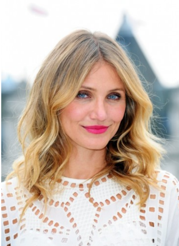
Fragment uit Glamour, 2015, Blondes have more fun.