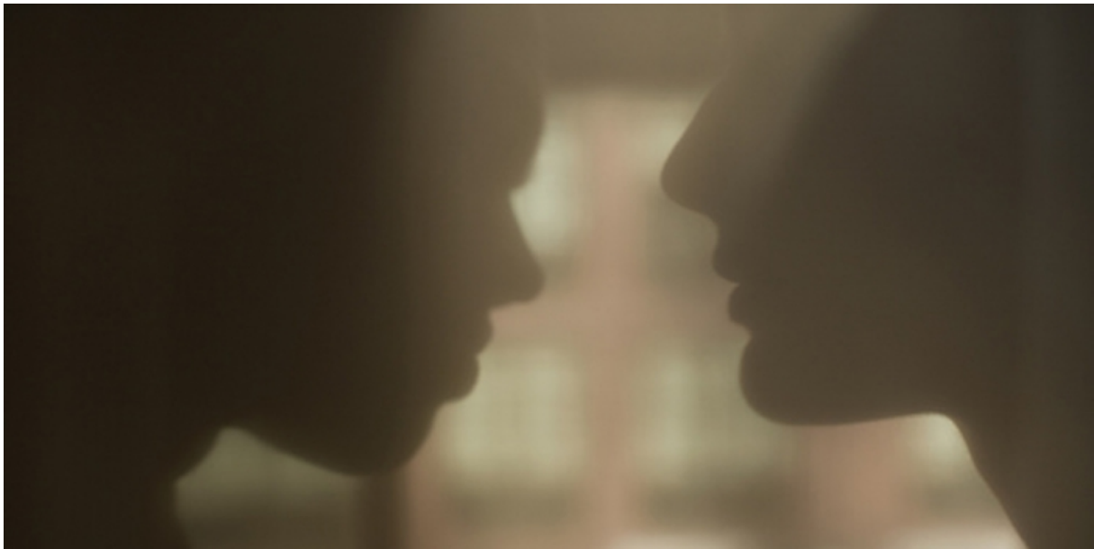
Figuur 3. Introductiefoto van het artikel over open relaties.

Fragment uit Elle , 2015, Ik heb wat ze noemen een open relatie.