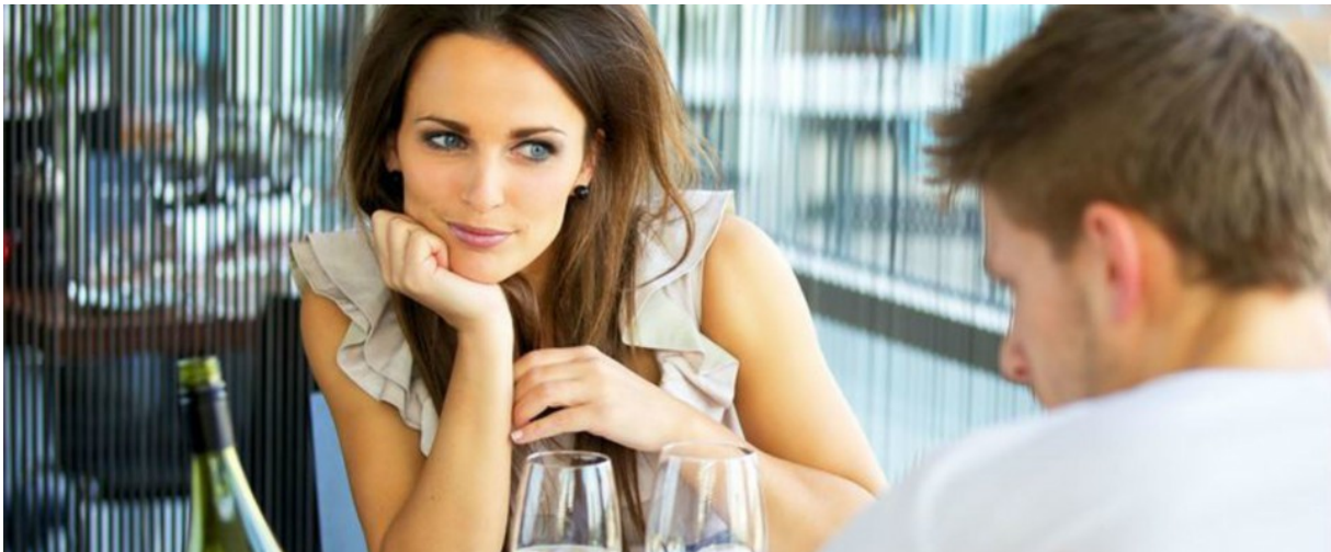
Fragment uit Grazia, 2015, Dit denken mannen over seks op een eerste date.