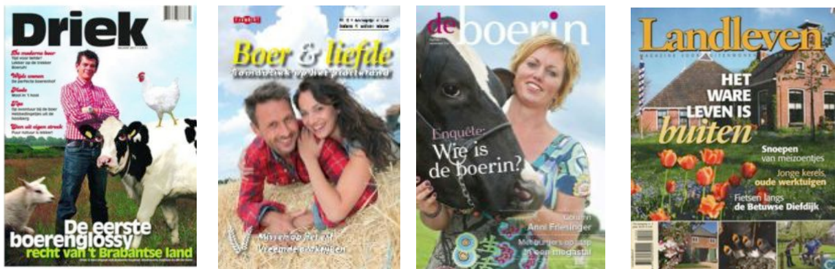
Figuur 2. Boerenglossy's . V.l.n.r: Driek (2011), Boer en Liefde (2011), de Boerin (2011) en Landleven (2010).