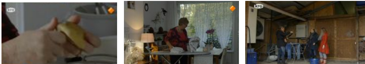
Figuur 5. Huishoudelijke taken

Als we het seizoen 2014/2015 van Boer Zoekt Vrouw bekijken, krijgen we een sterk vermoeden dat boeren er nogal traditionele denkbeelden op nahouden wat betreft de rolverdeling tussen mannen en vrouwen. Zodra de vrouwen op de boerderij komen logeren blijkt al snel dat de meeste vrouwen de huishoudelijke taken op zich nemen. De boeren (inclusief de lesbische boerin) doen het zware, mannelijke werk zoals het besturen van een tractor of het werken met een kettingzaag. Hun vrouwen hangen ondertussen de was op of staan in de keuken om aardappels te schillen, een appeltaart te bakken, of een kopje koffie in te schenken (zie figuur 5).