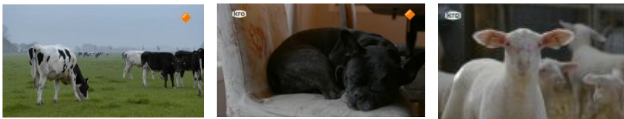
Figuur 2. Dieren op de boerderij

past blijkbaar niet in het beeld van de natuur dat Boer Zoekt Vrouw wil presenteren. Een bijzonder moment als de geboorte van een lammetje bij boer Jan wordt daarentegen uitgebreid gefilmd. Maar ook hier wordt het pijnlijke moment waarop de schattige lammetjes worden opgehaald voor de slacht juist niet in beeld gebracht. Pas wanneer de lammetjes in de vorm van gehakt terugkeren en boer Jan er met veel plezier lamsworstjes van maakt, is de camera er weer bij. Het feit dat dieren op de boerderij soms geslacht of geruimd moeten worden is dus geen onderdeel van het romantische beeld in Boer Zoekt Vrouw , wat zorgt voor een zeer eenzijdig beeld van het dierenleven op de boerderij en van de verhouding tussen de boer en zijn dieren.