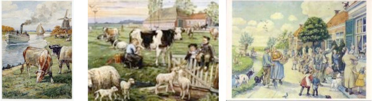
Figuur 1. Schoolplaten. Jetses. C. (+/- 1910). V.l.n.r: Koeien aan de vaart , De weide in de lente , Klassikale vertelselplaat .