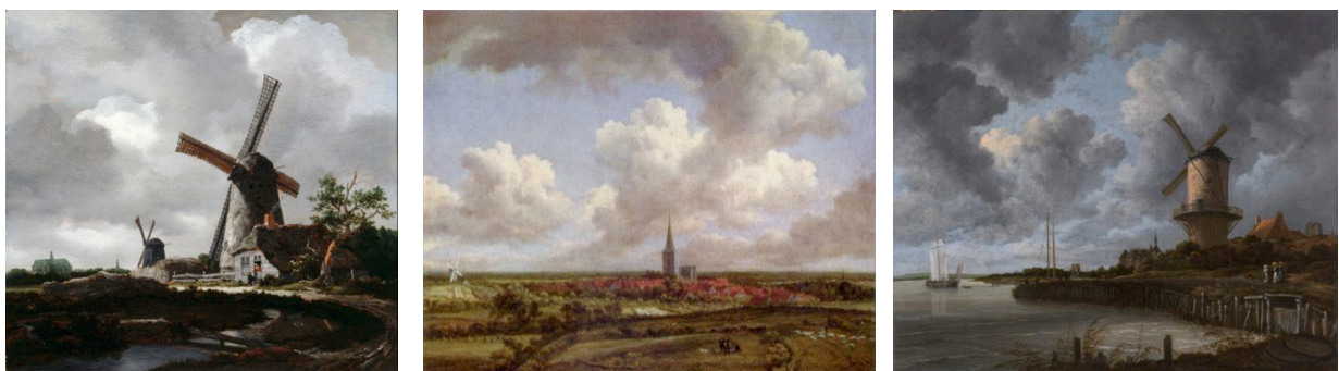
Figuur 3. Schilderijen. Van Ruisdael, J. (1650 – 1660). V.l.n.r.: Landschap met molen bij Haarlem , Gezicht op Ootmarsum , De molen bij Wijk bij Duurstede .