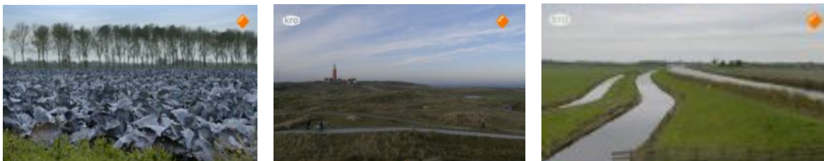
Figuur 1. Landschap

Uit de semiotische analyse van Boer Zoekt Vrouw is op de eerste plaats naar voren gekomen dat de schoonheid van de natuur in het programma een heel grote rol speelt. Na een kort shot aan het begin van het seizoen van presentatrice Yvon Jaspers in een drukke en onaantrekkelijke straat in hartje Amsterdam, reist de kijker al gauw met haar mee langs boerderijen verspreid door het land. Via charmante landweggetjes worden er verschillende boeren bezocht in de provincies Noord-Brabant, Noord-Holland, Gelderland, Zeeland en Groningen. De afstand tussen de boerderij van Bertie in de provincie Zeeland en de boerderij van boer Geert in de provincie Groningen is echter zo'n 350 kilometer en is hoogstwaarschijnlijk niet overbrugd via de rustieke weggetjes die in het programma te zien zijn. Toch is de snelweg op geen enkel moment in het seizoen in beeld gebracht en wordt er gesuggereerd dat Yvon Jaspers de boeren via een landelijke route bereikt. De omgeving van de geselecteerde boerderijen in Boer Zoekt Vrouw is overal even mooi en bestaat uit weilanden, akkers, bloemenvelden, duinen of bossen (zie figuur 1). Nergens wordt dit beeld verstoord door minder romantische elementen uit het Nederlandse landschap zoals bijvoorbeeld megastallen, fabrieken, snelwegen of autosloop-bedrijven.