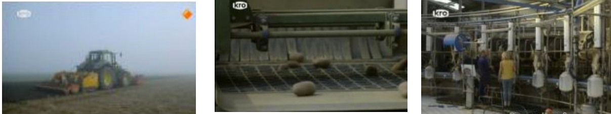
Figuur 6. Machines

fysieke boerenwerk. Door het buiten beeld laten van dergelijke belangrijke aspecten van het moderne boerenleven wordt er in Boer Zoekt Vrouw een eenzijdig beeld van het boerenbestaan gegeven.