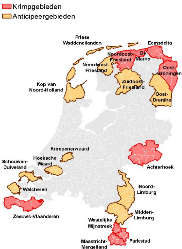
Figuur 1 - Krimp- en anticiperegebieden

Zoals hierboven is geschetst, hebben demografische veranderingen invloed op tal van beleidsvelden. Denk hierbij bijvoorbeeld aan voorzieningen, woningmarkt en economie. Het kabinet stelt dat deze ontwikkelingen elkaar kunnen versterken, waardoor het oplossen van eventuele problemen die hier uit voort komen lastiger wordt (Eerste Kamer, 2014). Anticiperegio's hebben vergelijkbare uitdagingen in het vershiet, met het verschil dat op het gebied van de woningmarkt de uitdagingen minder groot zijn. Dit komt bijvoorbeeld door 'verdunding', het feit dat de bevolking krimpt maar tegelijkertijd het aantal eenpersoonshuishoudens stijgt (Planbureau voor de Leefomgeving, z.d.). Deze punten hebben allemaal invloed op de vitaliteit van dorpen, steden en regio's. In de provincie Zeeland is door de rekenkamer aldaar onderzoek gedaan naar het krimpbeleid van de provincie Zeeland in de periode 2007-2012. Een van de aanbevelingen van de Rekenkamer heeft betrekking op de vraag of krimp als een exogene beleidsfactor wordt gezien of als beleidsthema. Zie je krimp als factor die invloed heeft op verschillende beleidsthema's of zie je krimp als een beleidsthema op zichzelf. Dit heeft namelijk gevolgen voor de manier waarop je als bestuur omgaat met het thema krimp (Rekenkamer Zeeland, 2013).