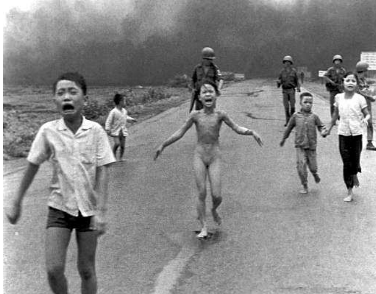
De foto van de rennende Phan Thi Kim Phuc die wegvlocht na een napalm-bombardement op haar dorp in 1972. Fotograaf Huynh Cong Ut werd voor deze foto beloond met de Pulitzer Prize.