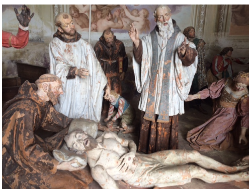
Franciscus van Assisi, Monte Sacro