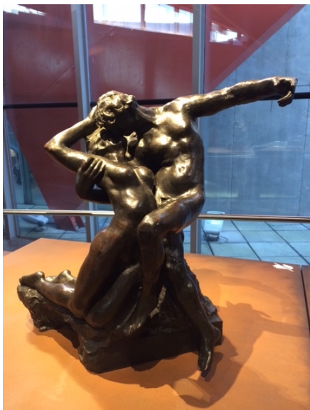
De eeuwige Lente, Rodin (1884)

Waarom is Lou jarenlang Rilke's 'vrouw' geweest? Omdat hij voor haar het werkelijke was: lichaam en mens voor het eerst onscheidbaar een, met alle onbetwifelbare waarachtigheid van het leven zelf. Lou heeft het hier niet over twee complementaire helften die elkaar zochten: het overrompelende geheel herkende zich huiverend in het onbevattelijke geheel! (Salomé, 1979, p. 141)