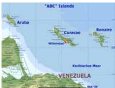
Fig. 1 Ligging Curaçao 7

De Antillen zijn gelegen in het Caribische gebied, vlakbij de kust van Venezuela. Zij vallen samen met Nederland en Aruba onder het Koninkrijk der Nederlanden en bestaan uit de volgende vijf eilanden: Bonaire, Saba, Sint Eustatius, een deel van Sint Maarten (het andere deel maakt deel uit van Frankrijk) en Curaçao. Curaçao heeft een oppervlakte van 444 vierkante kilometer en heeft 130.000 inwoners, waarmee dit het grootste eiland van de Nederlandse Antillen is. Het eiland bestaat uit 160 wijken, waarvan er 15 probleembuurten zijn (Bovenkerk, 2001).