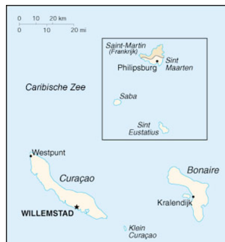
Fig. 2 De Nederlandse Antillen 8

Officieel kent het land één taal, het Nederlands, in praktijk is Papiaments de voertaal. Daarnaast wordt de Engelse en Spaanse taal ook vaak gebruikt. De bevolking bestaat uit diverse nationaliteiten en kent