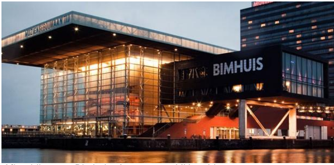
Afbeelding van Bimhuis, Amsteram, 3XN architecten 2004

strijd en ik denk dat deze initiatiefnemer een niet te onderschatten rol daarin heeft gespeeld. Hij heeft dus wel degelijk zijn wil door kunnen zetten, met zijn liefde voor de muziek, om een geweldig gebouw te maken. Ik denk nog altijd (misschien naïef?) dat deze man alle lof verdient. Deze initiatiefnemer kon er in mijn ogen ook voor kiezen om niet die piano mee te nemen. Dat hij dat elke keer wel deed is toch geen toeval? Latour is echter duidelijk in zijn vertoog dat in de wereld niemand individueel lof of blaam treft en dat alles terug te voeren is tot een contingent netwerk waarin ieder individu opgesloten zit.