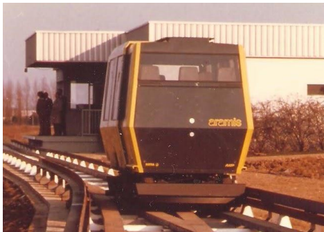
Afbeelding 1.1 Aramis prototype 1978

Net als mensen hebben de dingen volgens Latour altijd een eigen karakter. In het boek Aramis, or the love of technology beschrijft Latour het optuigen van een nieuw transportsysteem voor de stad Parijs. Het ontwikkelingsproces voor dit systeem start in 1970, naar aanleiding van de vraag en de behoefte van burgers voor een individueel transport in de stad. Er worden verschillende varianten bedacht en ontworpen en gedurende tien jaar lijkt het echt een succes te worden.