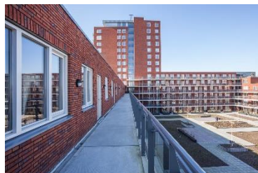
Afbeelding 2.2 lusthofcomplex: Aanzicht voorzijde en binnentuin, IAA architecten 2015

Het net nieuw verschenen gebouw dat ik al een aantal keren noemde, het Lusthofcomplex, is een gebouw waarbij in mijn ogen keuzes zijn gemaakt die haaks staan op hetgeen de visies van Rotterdam uit willen dragen. Het gebouw lijkt los te liggen als een capsule, als een zelfstandige entiteit. Hierbij zien we dat de dingen, de uitgewerkte ideeën van het gebouw, direct de mensen die van het gebouw gebruik maken, beïnvloeden. Het gebouw wordt gedictieerd door economisch optimisme. De vierkante meters op de begane grond zijn enkel verhuurd aan commerciële instellingen die de hoge huur kunnen