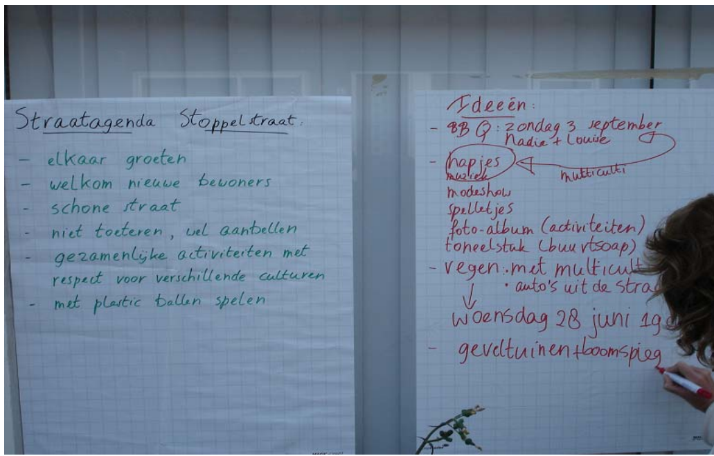
Afbeelding 2: Het opstellen van de straatagenda voor de Stoppelstraat

De bewoners die naar de presentatie komen, zijn vaak bewoners die zich actief willen inzetten voor de buurt. Daarvòòr kunnen echter ook al potentiële gangmakers gerekruteerd worden: