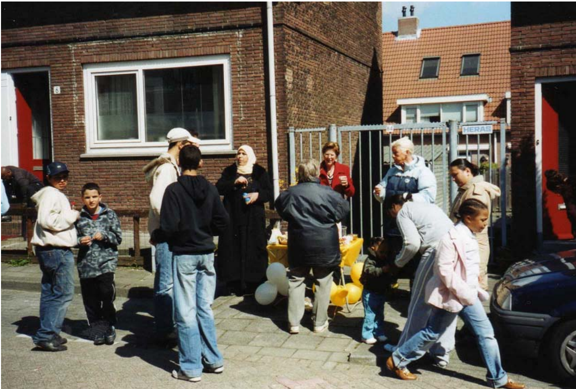
Paasfeest in de Stoppelstraat, Tarwewijk

Een kwalitatief onderzoek in Charlois en Feijenoord naar de gevolgen van participatie in “Mensen Maken de Stad” voor interetnisch contact