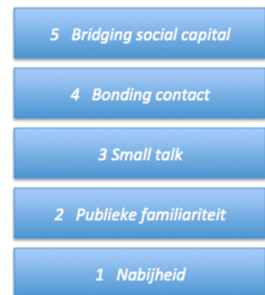
Figuur 2 - contacttypologie

Om te definiëren welke vorm van contact er is tussen buurtgenoten op buurtfaciliteiten is er een contacttypologie ontwikkeld zoals weergegeven en omschreven in het theoretisch kader. Deze typologie geeft inzicht en handvatten voor het analyseren van de interviewresultaten. Aan de rechterzijde is deze ladder van contactvormen schematisch weergegeven. De interview- en observatiedata zijn geclassificeerd volgens deze ladder van contactvormen.