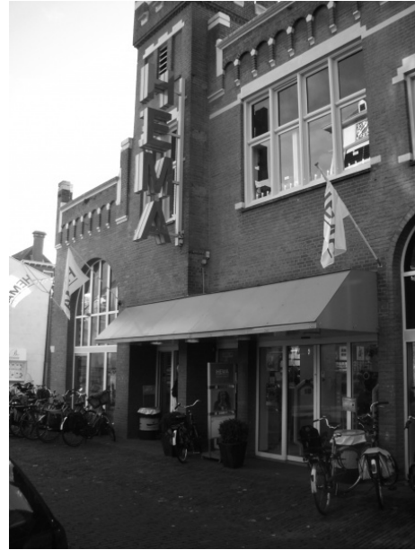
Foto 2: Hema, voormalige Muntbioscoop, ± 2005

De discussie rond de bioscoop was echter nog niet ten einde. Toen de gemeente Enkhuizen in 1977 bekend maakte de nieuwe bioscoop te huisvesten op de hoek van het Verlaat en de Erwtenmarkt (Foto 3), uitte het bestuur van de vereniging OE kritiek. Het bestuur was namelijk van mening dat het historische karakter van de panden op deze plek van de binnenstad werd aangetast. Eerder, in 1974, had het bestuur ook al bezwaarschriften gestuurd vanwege de uitbreiding van de Enkhuizer broodfabriek Enkhuizer Banket, die zich op dezelfde straat bevond. Deze uitbreiding zou ten koste gaan van acht huizen. 215 De bezwaren waren tijdens een vergadering van de gemeenteraad gedeeltelijk gegrond en gedeeltelijk ongegrond verklaard. Wilde het bestuur van Vereniging OE alsnog bezwaar maken, dan bestond de mogelijkheid bij Gedeputeerde Staten van Noord-Holland een bezwaarschrift in te dienen. 216 Uiteindelijk was een bezwaarschrift tegen uitbreiding van de broodfabriek was niet nodig, omdat het gemeentebestuur zelf van de plannen afzag.