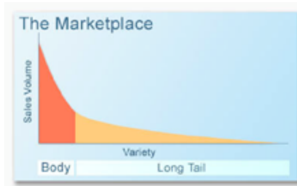
Afbeelding 4: De vraagcurve van de Long Tail

nichemarkten in de toekomst in verschillende industrieën veel belangrijker zullen worden. De volgende afbeelding representeert de hoofdgedachte van de theorie: