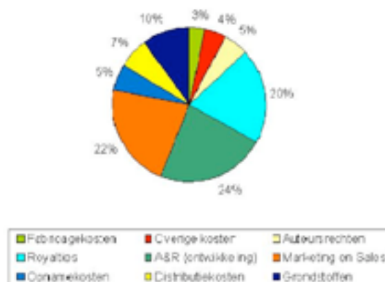
Afbeelding 1: kostenverdeling platenmaatschappij bij productie van een cd