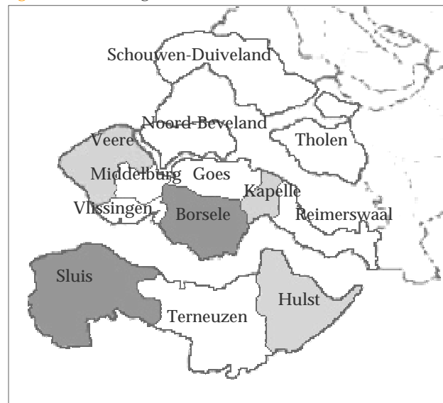
Figuur 10: Zeeuwse gemeenten

In totaal wonen er in de provincie Zeeland ongeveer 380.000 mensen, die te vinden zijn in de dertien gemeenten die na de gemeentelijke herindeling van 2003 zijn overgebleven (Provincie Zeeland, 2004b). De gemeenten verschillen sterk in inwoneraantal, grondoppervlak en voorzieningenniveau, maar ook door de gespreide ligging over de verschillende 'eilanden' lopen de opgaven waarmee zij te maken krijgen uiteen (zie figuur tien voor een overzicht van de Zeeuwse gemeenten). Zo kampen de gemeenten in Zeeuws- Vlaanderen met een krimp van de bevolking, terwijl Schouwen-Duiveland een lichte groei kent doordat zij mensen trekt uit het zuidelijke deel van de Randstad. De provincie Zeeland heeft een viertal stedelijke gemeenten – Vlissingen, Middelburg, Goes en Terneuzen – en negen meer landelijke gemeenten. De stedelijke gemeenten die voor het onderzoek zijn benaderd zijn Terneuzen, Vlissingen en Goes, en de landelijke gemeenten zijn Hulst, Borsele en Schouwen-Duiveland. Gemeenten onderhouden veel structurele contacten met woningcorporaties en meer incidentele contacten met de provincie en ontwikkelaars. Contacten met de provincie hebben vaak betrekking op de planningslijsten en ontwikkelaars komen in beeld als er zich concrete projecten aandienen of in ontwikkeling zijn.