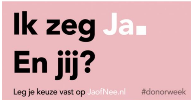
Afbeelding 2 Oude campagne-uiting

uiting voor een nieuwe publiekscampagne en behandelt de bezorgdheid over de handel in organen.