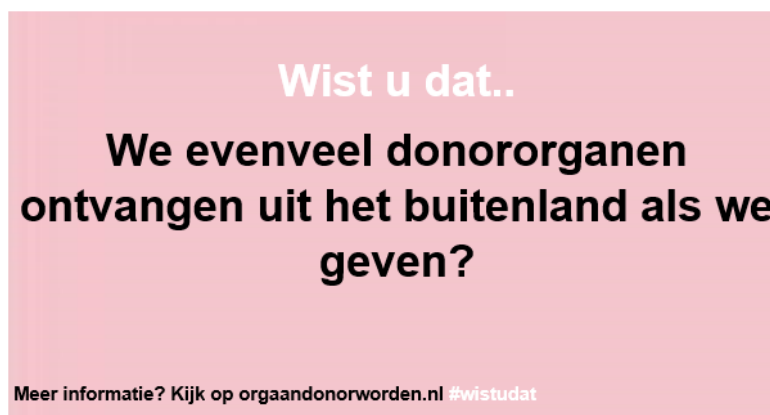
Afbeelding 3 Nieuwe campagne-uiting

In vorige publiekscampagnes werd opgeroepen om elkaar de vraag te stellen om donor te worden. In toekomstige campagnes kan dit idee wellicht uitgebreid worden door dit concreet en meetbaar te maken. Mensen zouden anderen bijvoorbeeld via Whatsapp of Facebook kunnen vragen om donor te worden met een link erbij naar het donorregister, waardoor iemand zich direct aan kan melden als donor. Wanneer iemand zich heeft geregistreerd krijgt de initiatiefnemer een melding en kan de nieuwe donor het verzoek weer doorsturen naar een volgend persoon. Net als de oude campagne-uiting uit Afbeelding 2 wordt hier gebruik gemaakt van social proof en wordt er een subjectieve norm uitgedragen. Dit advies zou vooral kunnen werken bij de mensen die aangeven nog geen keuze te hebben gemaakt omdat ze er nooit aan gedacht hebben of het zijn vergeten, omdat ze de kans krijgen zich meteen aan te melden als donor en de sociale druk van een vriend voelen.