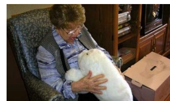
Foto 1: Paro op schoot