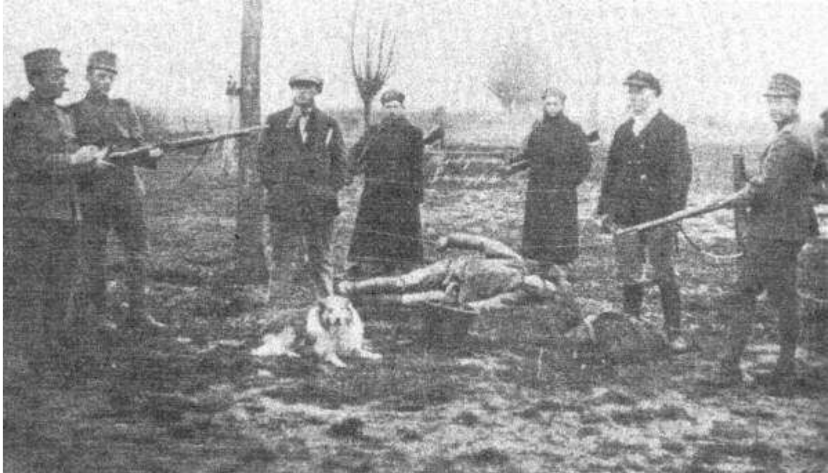
Smokkelaar in aanraking gekomen met 'de Dodendraad'

Masterthesis Maatschappijgeschiedenis Bart Begijn Begeleider: H.A.M. Klemann