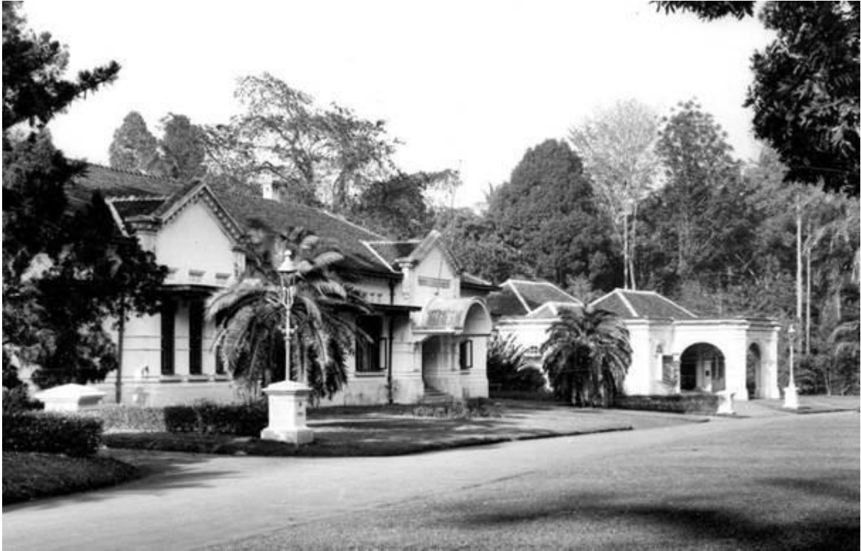
Treub's Laboratorium in Buitenzorg.