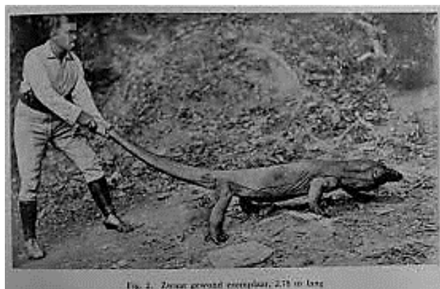
Figuur 1.1: Jacht op een Komodovaraan rond 1928. 9

In het verslag van 1924 zijn (naast de verhoudingen flora-fauna in de nieuwe of aangevraagde natuurmonumenten) ook andere aanwijzingen te vinden dat het beschermen van fauna een steeds belangrijker onderwerp wordt voor de Vereeniging. Zo worden nieuwe natuurmonumenten niet alleen meer beschreven vanuit een invalshoek gericht op de flora, maar wordt ook het belang van enkele dieren aangehaald. Zo is het Saobi-terrein aangevraagd wegens onder meer ‘de fraaie zeeduif, herten en wilde runderen’. 8 In 1927-1928 wordt er in de Vereeniging aandacht gevraagd voor de ‘reuzen-hagedis’ op de eilanden Komodo en Rindja hetgeen blijkbaar geen uitleg behoefde voor de beschermingsreden want het jaarverslag laat het bij het noemen van de diersoort.