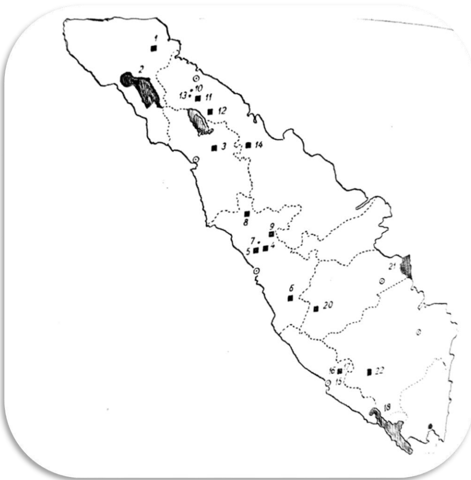
Figuur 2.2 Wildreservaten op Sumatra (zwarte vlekken) en natuurmonumenten (witte en zwarte stippen). De Commissie heeft het tweede reservaat van boven geïnitieerd. 45

‘Wij mogen ons hier wel zeer bijzonder over verheugen, vooral wanneer wij het als plicht gevoelen, om in het belangrijke en schoone deel der wereld, dat nu reeds meer dan drie eeuwen onder onzen invloed staat, het natuurleven voor verarming en vervlakking te behoeden. Wat België in de Congo doet en het Britsche Rijk in Centraal en Zuid-Afrika behooren wij op minstens gelijke schaal in Insulinde te ondernemen’. 44