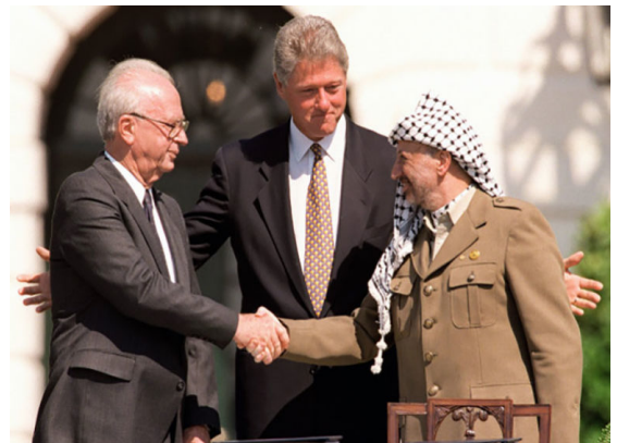
Afbeelding 5: Rabin, Clinton en Arafat in 1993