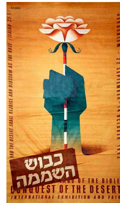
Afbeelding 3: Postzegel Wereldtentoonstelling 1953

De Journal of Palestine Studies heeft vijftig jaar na de oprichting van de staat een relevant vergelijkbaar onderzoek gedaan en interviews gehouden onder Palestijnen met betrekking tot hun herinnering aan de Nakba , de oprichting van de staat Israël. De belangrijkste thema's die hierin naar voren kwamen, zijn de volgende. De Nakba is een traumatische herinnering voor de eerste en tweede generatie Palestijnen. Het is moeilijk om deze herinnering te onderscheiden van die van je omgeving en de collectieve herinnering. De herinnering staat in het teken van de speciale status die martelaren hebben bij Godvluchtelingen, angst, hongersnood en gebrokenheid, want doordat de imams de bezetting