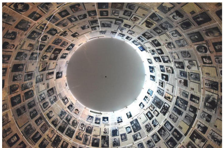
Afbeelding 2: Yad Vashem: Hall of Names