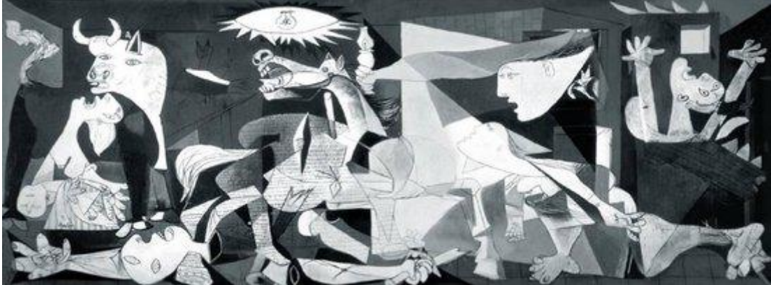
Picasso's Guernica. Museo Nacional Centro del Arte Reina Sofia, Madrid