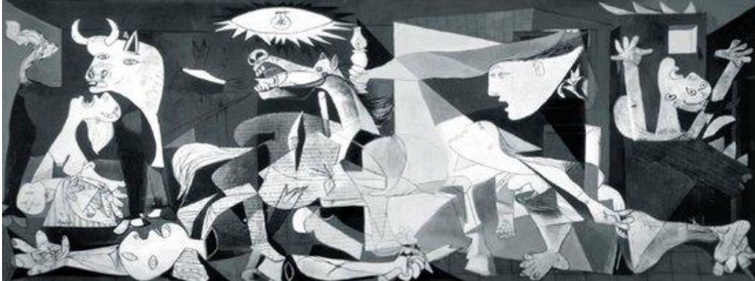
Picasso's Guernica. Museo Nacional Centro del Arte Reina Sofia, Madrid

Als illustratie voor deze scriptie heb ik het schilderij van Picasso genomen. Hij maakte het naar aanleiding van het barbaarse bombardement op de Spaanse stad Guernica van 26 april 1937. Dit bombardement werd uitgevoerd ter ondersteuning van Franco tijdens de Spaanse Burgeroorlog (1936-1939) waarbij de democratisch gekozen Republikeinse regering het onderspit delfde en een aan het fascisme gelieerd dictatoriaal bewind werd gevestigd, dat tot november 1975 (!) aan de macht bleef. Het nationale conflict kreeg een internationale dimensie: het bombardement werd uitgevoerd door de luchtmachten van Nazi-Duitsland en het fascistische Italië. Het schilderij is een blijvende en indringende waarschuwing tegen barbarij en de bedreigingen van de democratie toen en nu. Die waarschuwing werd toen onvoldoende herkend, wat leidde tot het enorme onheil door mensenhanden aangericht, die zijn weerga in de geschiedenis niet kende. Het geeft een dubbele betekenis aan de hiervoor geciteerde poëzie van Deelder en Lucebert.