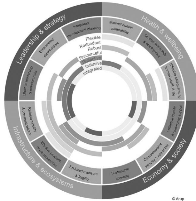
Figuur 1. The City Resilience Framework.

robuust moeten zijn (Spaans en Waterhout, 2017). Het kader zou steden moeten helpen bepalen waarin geïnvesteerd moet worden, zodat voornamelijk kwetsbare bewoners overleven en gedijen wanneer stressoren zich voordoen (ARUP & the Rockefeller Foundation, 2014).