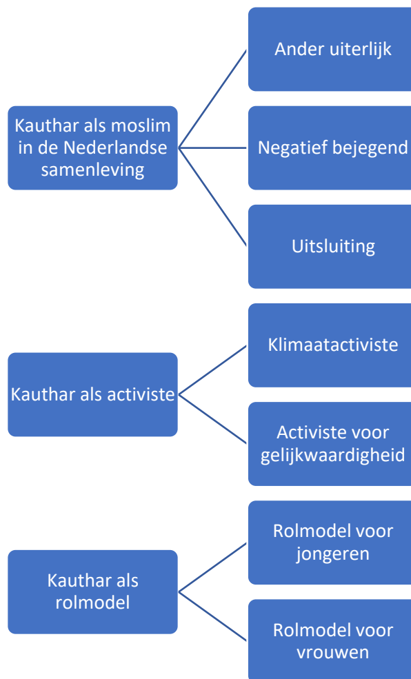
Figuur 1: Codeboom inhoudsanalyse

In hoofdstuk 4 licht ik deze thema's uit de inhoudsanalyse toe aan de hand van voorbeelden uit de mediafragmenten. In paragraaf 3.3 licht ik toe hoe ik enkele delen van de mediafragmenten heb verwerkt in de semigestructureerde diepte-interviews.