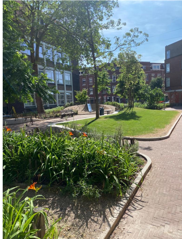
Afbeelding 2 Kokerplein