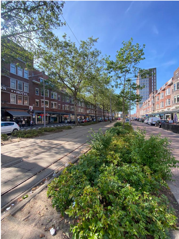
Afbeelding 1 Beijerlandselaan

casestudy . De locatie kan namelijk beschouwd worden als een ontwikkeling waarbij, zowel de participatie als de uiteindelijke inrichting van het plein, niet aan de wensen van de bewoners voldoet.