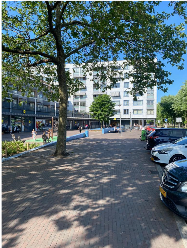
Afbeelding 4 Lidlplein