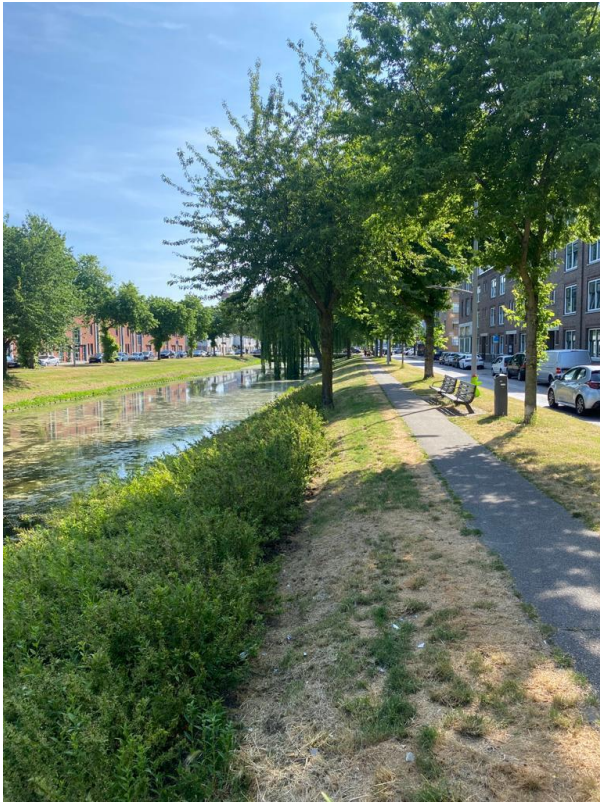
Afbeelding 3 Lange Hilleweg

inrichting van het Lidlplein. Deze positiviteit rondom de ontwikkeling maakt van het Lidlplein een locatie voor deze casestudy . De locatie kan beschouwd worden als een ontwikkeling die geslaagd is op het gebied van participatie en de uiteindelijke inrichting aan de wensen van de bewoners voldoet.