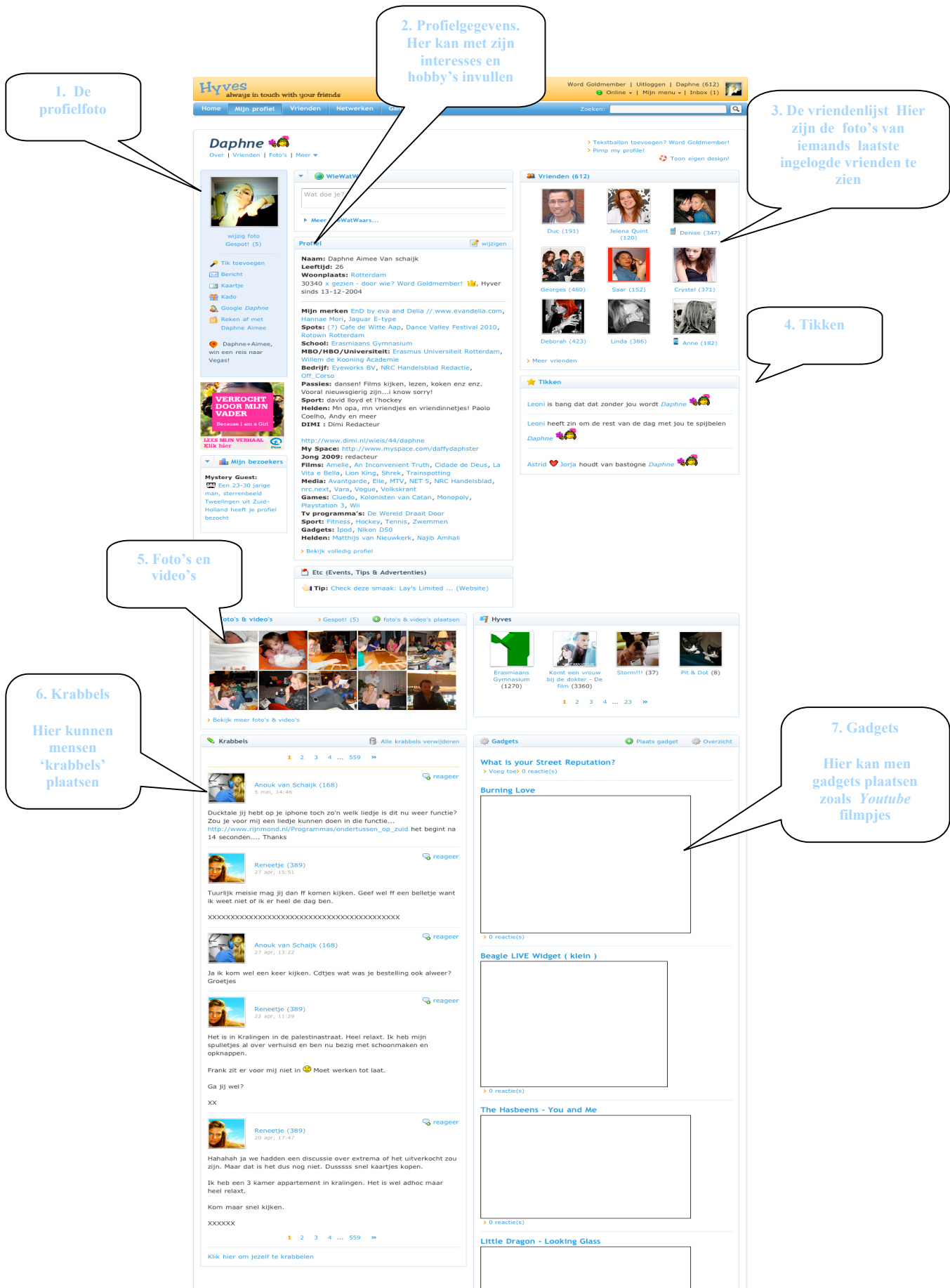
Afbeelding 1 voorbeeld van een Hyves-profiel