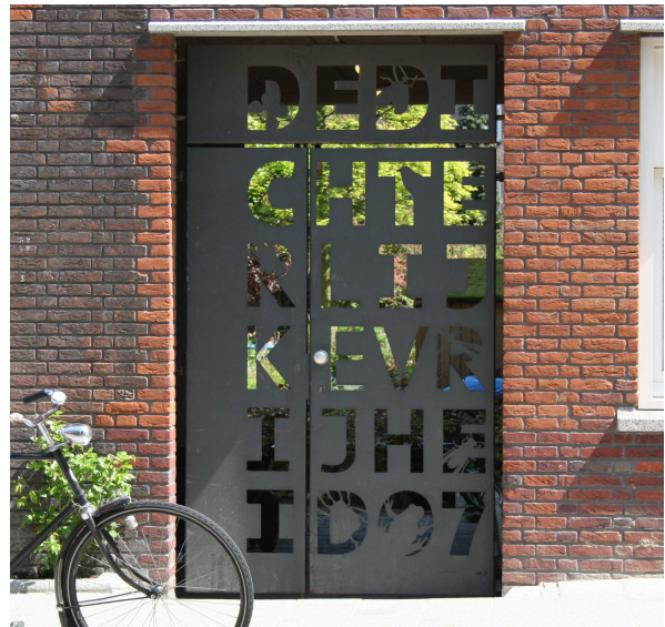
Afbeelding 4.2 Wallisblok

woningvoorraad kan er gezegd worden dat sprake is van gentrification in Spangen.