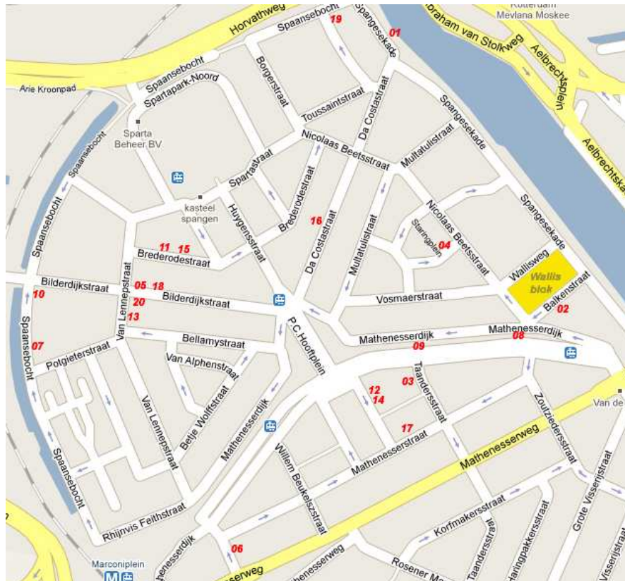
Abbeelding 5.1 Spreiding van Respondenten in Spangen

dingen wilden zeggen. Ze was tevreden in Spangen en daarmee uit.