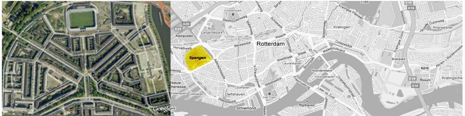
Afbeelding 4.1 Spangen